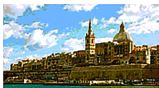
Malta La Valletta vista dal mare

L'Atlantico in cui sono adagiate le sue 10 isole non è certo il Mar Rosso - della cui clientela cerca di appropriarsi - ma l'arcipelago di Capo Verde, a ovest della costa senegalese, offre attrattive paesaggistiche interessanti per la diversità fra le isole, la vicinanza dal-